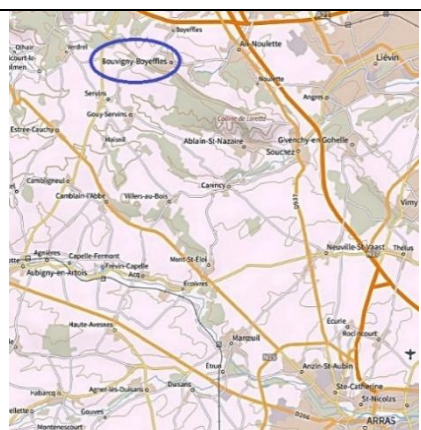
Bouvigny-Boyeffles : environ 2400 boviniennes et boviniens.