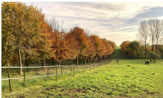
Les couleurs de l'automne dans les environs du château de Grosville à Rivière.

La sucrerie, brasserie, malterie dite "sucrerie Grard, Dujardin et Cie", puis "brasserie-malterie Caron" du XIXème siècle.