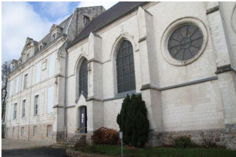
L'église Saint-Martin accolée au château.

1926 : l'église est inscrite aux Monuments Historiques. L'église fait partie du circuit des églises fortifiées de l'Artois.