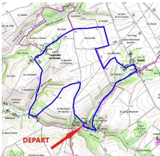
Le circuit au départ de l'abbaye de Belval.

Départ covoiturage - parking du Crinchon Arras - 7h25.