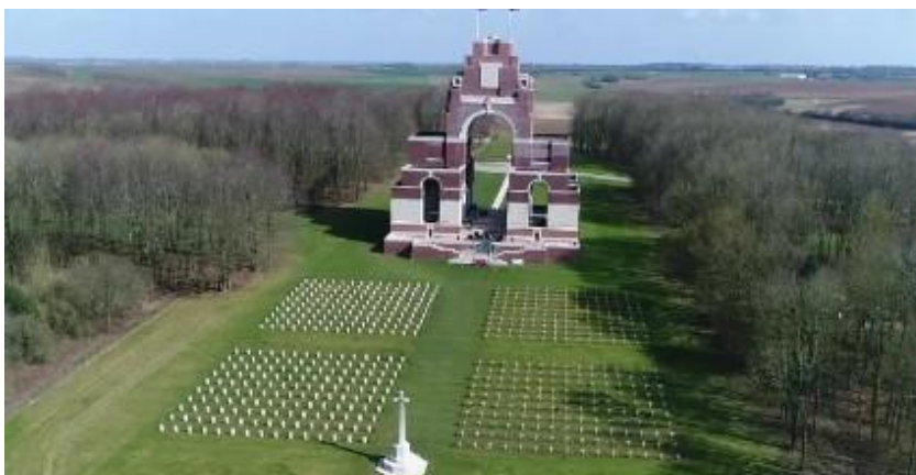
Le mémorial de Thiepval.