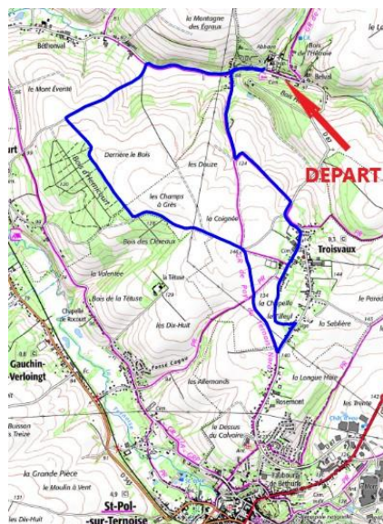
Circuit de l'après-midi : 8km