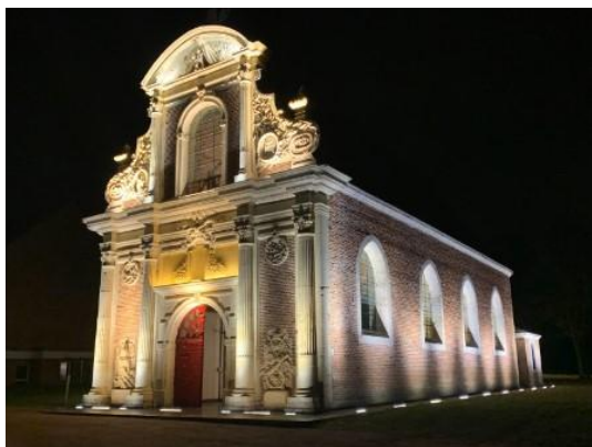
la chapelle Saint-Louis