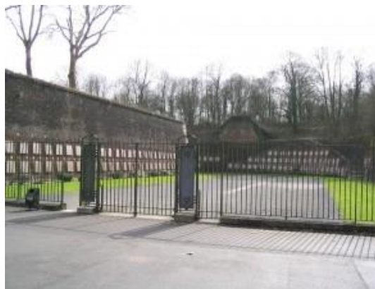
le Mémorial du Mur des fusillés