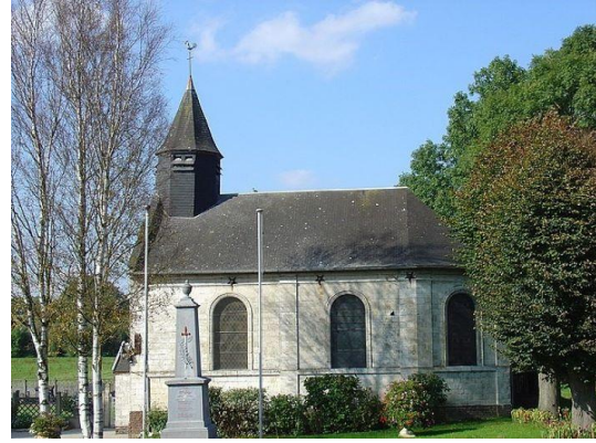
église Saint-Maclou de Gouves