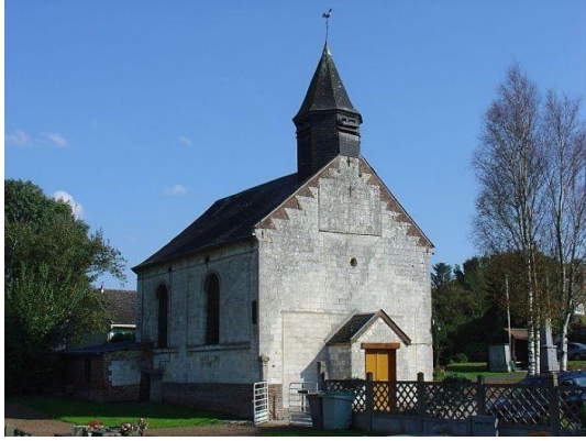
église Saint-Maclou de Gouves