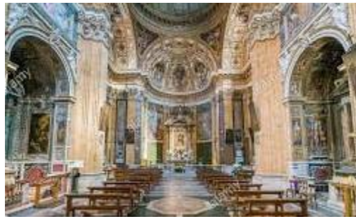
Santa-Maria ai Monti - Roma