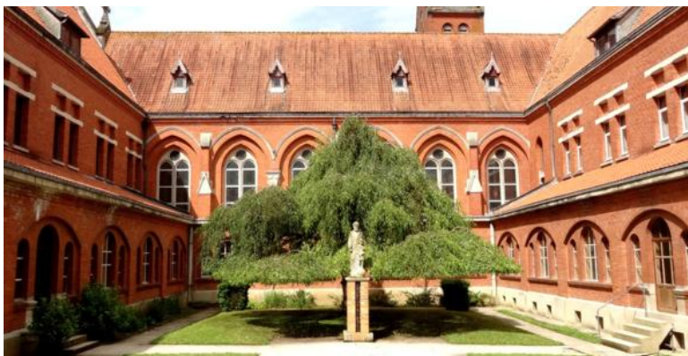
L'Abbaye Notre-Dame de Belval

Les communes concernées par cette randonnée sont :