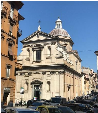
Santa-Maria ai Monti - Roma