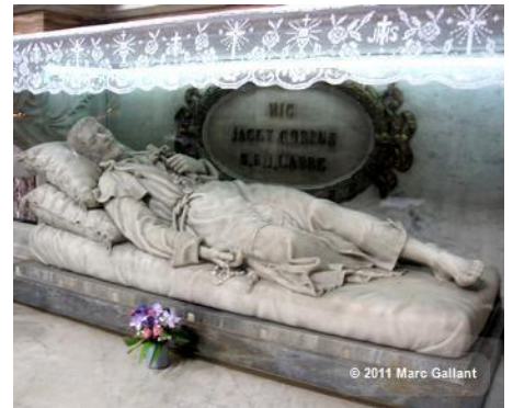
Gisant de Saint Benoît-Joseph Labre