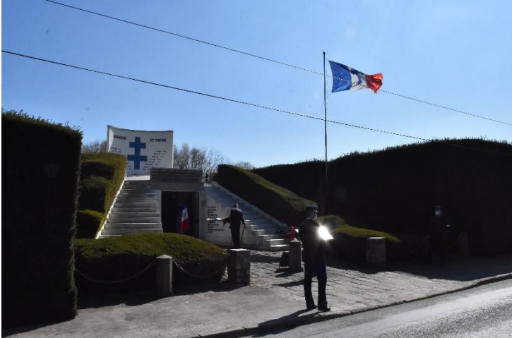
la crypte "des martyrs de Munich"