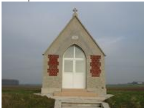
la chapelle de Prémont