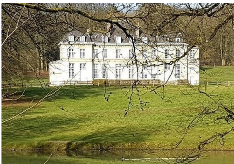
Le château de Pas en Artois vu du bois de St Pierre

La pierre "des Guétifs" située sur la grand-place servait, paraît-il, de trône au chef de la confrérie.