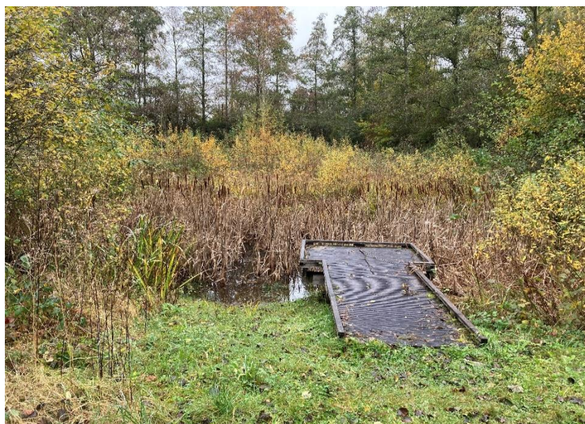
Une vue de site "Chico Mendés"