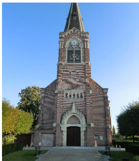
l'église Saint Martin

Les "Opérations Chico Mendés" sont menées dans les Haut de France par l'association Nord Nature Chico Mendés . Les communes de Aire sur la Lys, Aubers, Saint-Venant et bien d'autres en bénéficient.