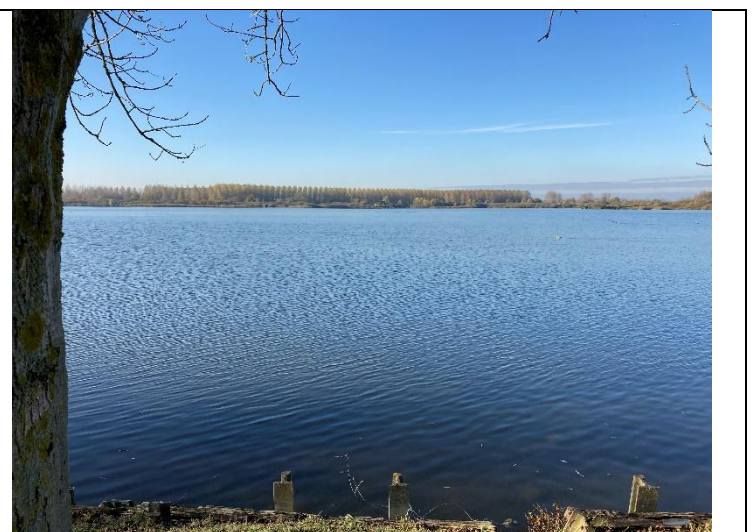
l'étang du Grand Clair