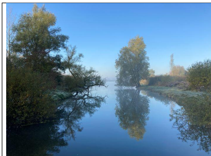
l'étang d'Ecourt St Quentin

Le nom du village de Palluel vient du latin palus, qui veut dire marais. Le marais du Grand Clair (paradis des pêcheurs) est associé à une légende : il aurait été la demeure d'une méchante fée qui jeta un sortilège au Comte d'Oisy. Est-ce la proximité de ces eaux étranges qui explique la présence dans les parages de pierres, de menhirs, de dolmens et autres cailloux de légende ?